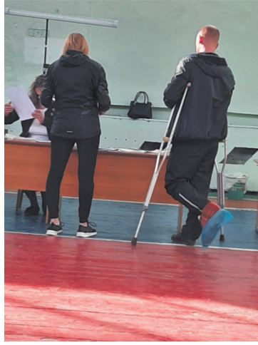
Схема досрочного голосования была отработана. Со стороны было видно, что практически каждый день предварительного голосования был закреплен за определенным предприятием. Все дни я присутствовал на выборах лично. А поскольку меня многие знают, то люди подходили поздороваться и говорили, что их обязали проголосовать в определенный день за определенного кандидата

та, для чего специально отпустили с работы. Конечно, сообщалось это в личной беседе на условиях анонимности, но не верить таким словам причины нет — это подтверждал весь ход предварительного голосования. Пачками шли «марбумовцы», в другой день — ВЭМЗ, затем — тепловые сети и т.д. В рабочие дни голосование начиналось в 16 часов, к этому времени выстраивалась целая очередь из желающих выполнить волю начальства.