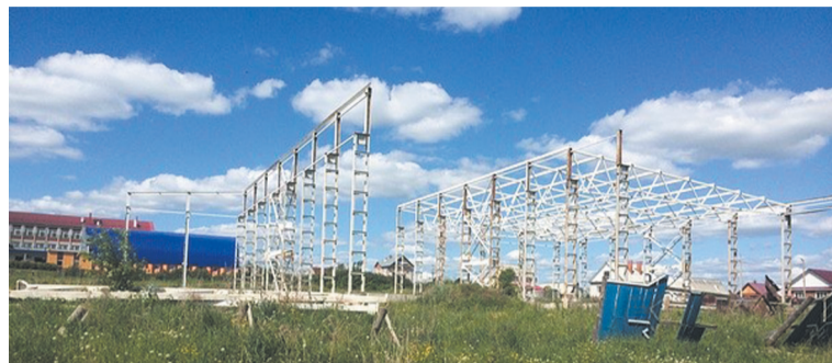
На снимке: Куженерская «спортивная Мекка»

Самые низкие тарифы для промышленных предприятий - в Краснодарском крае (1,75 руб./кВтч), Мурманской (2,13 руб./кВтч) и Иркутской областях (2,15 руб./кВтч), Дагестане (2,24 руб./кВтч) и Свердловской области (2,44 руб./кВтч).